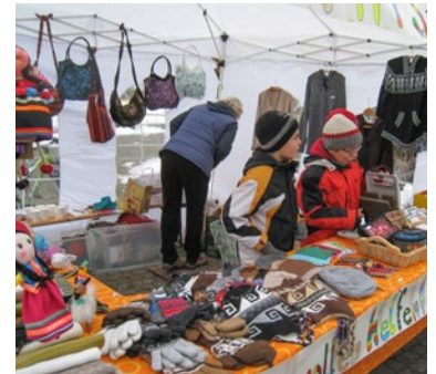
Der Verkauf von Produkten aus Peru