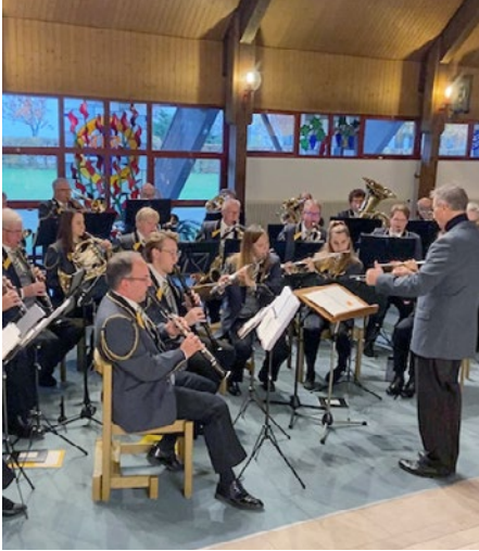
Gottesdienste in diversen Pfarreien. Unter anderem in Wetzikon, mit der Harmonie