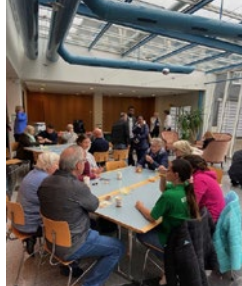
Anschliessend ein Apero für alle

Auch in der Schweiz war das Jahr 2023 wieder erfüllter als in der Coronazeit. Gottesdienste in diversen Pfarreien standen im Vordergrund. Pfarreien, die schon seit Jahren oder Jahrzehnten Paz Peru unterstützen.