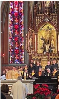
Peter und Paul ZH

Diesen, aber auch besonders Privatpersonen sei herzlich gedankt für alle Spenden.